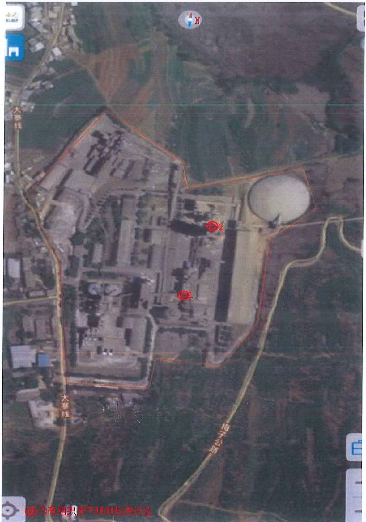
附件 1：检测点位示意图